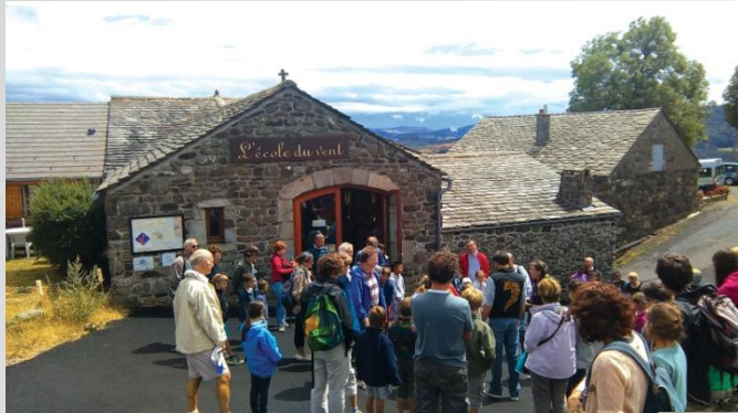
L'école du Vent St-Clément