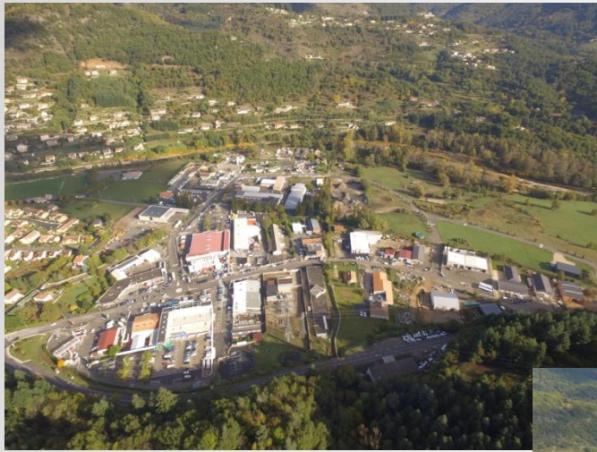
Zones d'activité de La Palisse et des Prés de l'Eyrieux Le Cheylard