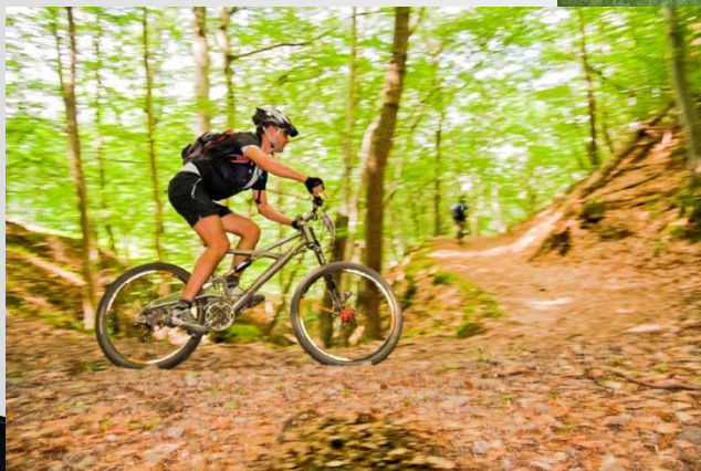
Le Lac de Devesset et sa base de loisirs