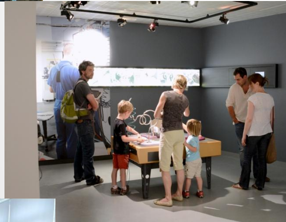
Un réseau de lecture publique