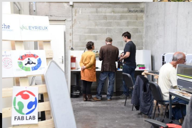
Le fablab La Fabritech