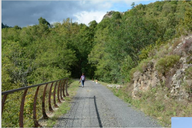
Voie douce La Dolce Via