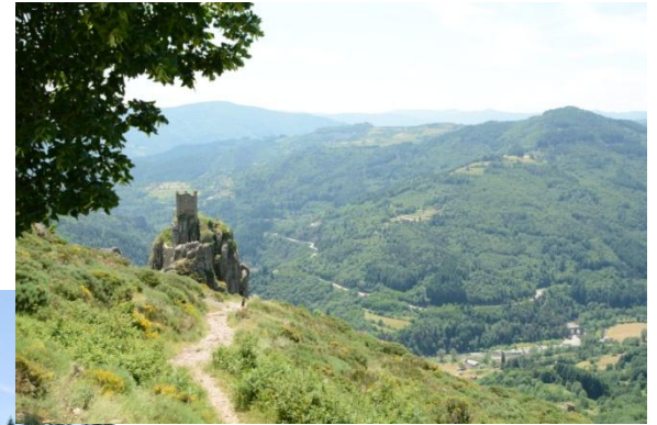
Château de Rochebonne St-Martin-de-Valamas