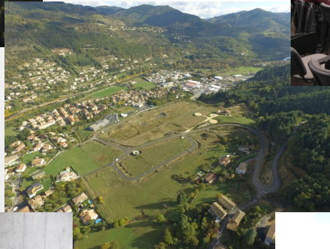
Zone d'activité Aric Industrie Le Cheylard